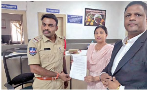
పంజాగుట్ట పోలీసుస్టేషన్లో ఎన్ఫోర్స్ ఫిర్యాదు కాపీని అందజేస్తున్న సింగర్ మంగ్లీ