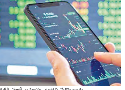
ధోరణికి మారే అవకాశం ఉందని పేర్కొన్నారు. ఈ వారం ముఖ్యమైన అంశం ఏప్రిల్ 14న మార్కెట్ సెలవు ఉండటంతో వారపు ఎక్స్ పేరిన్ ముందుగానే ఏప్రిల్ 13, సోమ వారానికి మార్చడమని ఒక విశ్లేషకుడు తెలిపారు. తదుపరి వారం

ముంబై, ఏప్రిల్ 12: పరుగుగా ఆరు వారాల పతనానంతరం బలమైన రికవరీ నమోదు చేసిన భారతీయ స్టాక్ మార్కెట్, కొత్త వారంలో జాగ్రత్తలతో కూడిన ఆకావాద దృక్పథంలోకి ప్రవేశించింది. భౌగోళిక రాజకీయ ఉద్రిక్తతలు తగ్గి అవకాశాలు మరియూ దేశీయ స్థూల ఆర్థిక పరిస్థితులు స్థిరంగా ఉండటంతో పెట్టుబడిదారులు సమ్మతం పెరిగింది. ప్రపంచ సంకేతాలు, కార్పొరేట్ ఫలితాలు, కర్మిన్ మార్కులు రాబోయే రోజుల్లో మార్కెట్ దిశను నిర్ణయించే అవకాశం ఉంది. గత వారం భారతీయ క్రీడితే సూబీలు బలంగా పుంజుకున్నాయి. బెంచ్ మార్కు సూబీలు దాదాపు 6 శాతం పెరిగి వారాంతానికి సమీప గరిష్ఠ స్థాయిల వద్ద ముగిసాయి. సిడ్నీ 24,050.60 వద్ద స్థిరపడగా, సెన్సెక్స్ 77,550.25 వద్ద ముగిసింది. ప్రపంచ పరిణామాల ఆసక్తికరంగా ఉండటం మరియూ దేశీయ ఆర్థిక స్థితి బలంగా ఉండటం పెట్టుబడిదారులను ఉత్సాహ పరిచింది. సిడ్నీ సాంకేతిక దృక్పథం నిపుణులు ముఖ్యమూ, 24,000 స్థాయికి దిగువన స్వల్పమైన బ్రేక్ వస్తే, ఇటీవలి పిలుగుల ద్వారా తీవ్రమైంది మళ్లీ సెన్ అండ్ బజ్ మార్కెట్