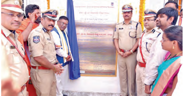
కన్నెపల్లి నూతన పోలీస్ స్టేషన్ లు అధికార ప్రజాప్రతినిధులతో కలిసి ప్రారంభించిన డిజిపి శివధర్ రెడ్డి

మంచుర్యాల, కొమరభొండ్ల అసిఫాబాద్ జిల్లాల్లో డిజిపి పర్యటన